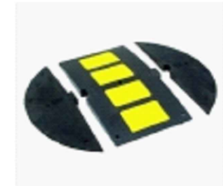
гумен ограничител на скоростта до 40 км в час, Н = 5 см